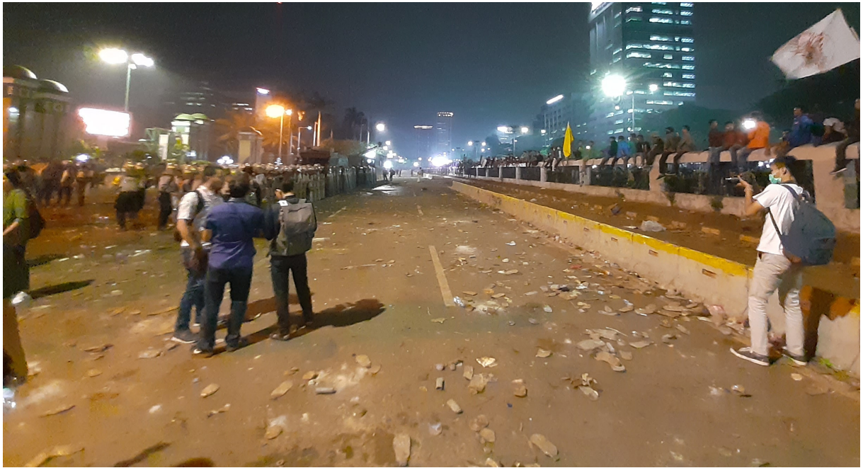
Suasana di depan gedung DPR Senayan usai demonstrasi mahasiswa menolak revisi UU KPK, RKUHP, di Jakarta, 24 September 2019.

tersebut sangat beragam, mulai dari kekerasan fisik, seperti terkena lemparan batu dari massa aksi, dipukul oleh polisi, hingga perampasan alat kerja, penghalangan liputan oleh polisi, persekusi oleh massa aksi, dan penghapusan karya jurnalistik. Jurnalis juga mengalami perusakan alat kerja dan kendaraan oleh massa aksi dan polisi. Jurnalis tetap menjadi sasaran kekerasan meski mereka telah menunjukkan kartu identitasnya.