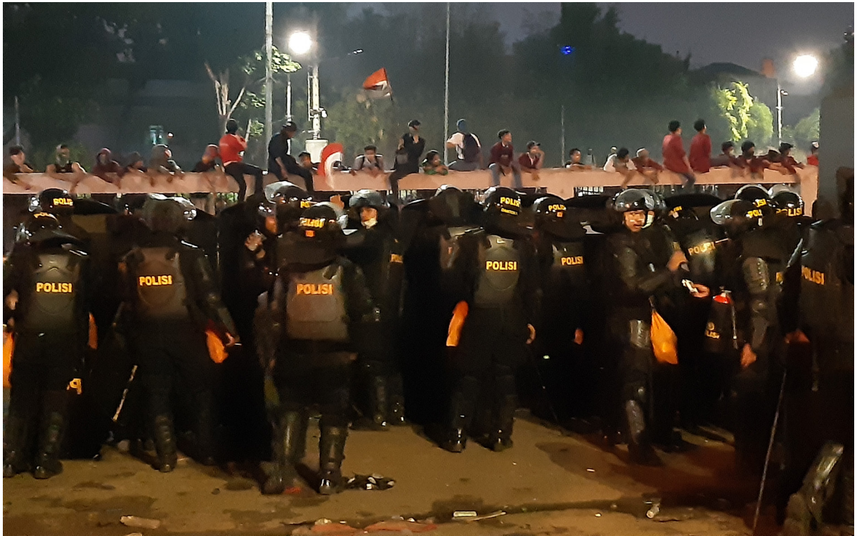
Massa dan polisi di depan gedung DPR Senayan usai demonstrasi menolak revisi UU KPK, RKUHP, di Jakarta, 24 September 2019.

baik mengesankan bahwa RUU KUHP itu tak mengikuti perkembangan internasional yang mendorong penyelesaian semacam itu melalui jalur perdata.