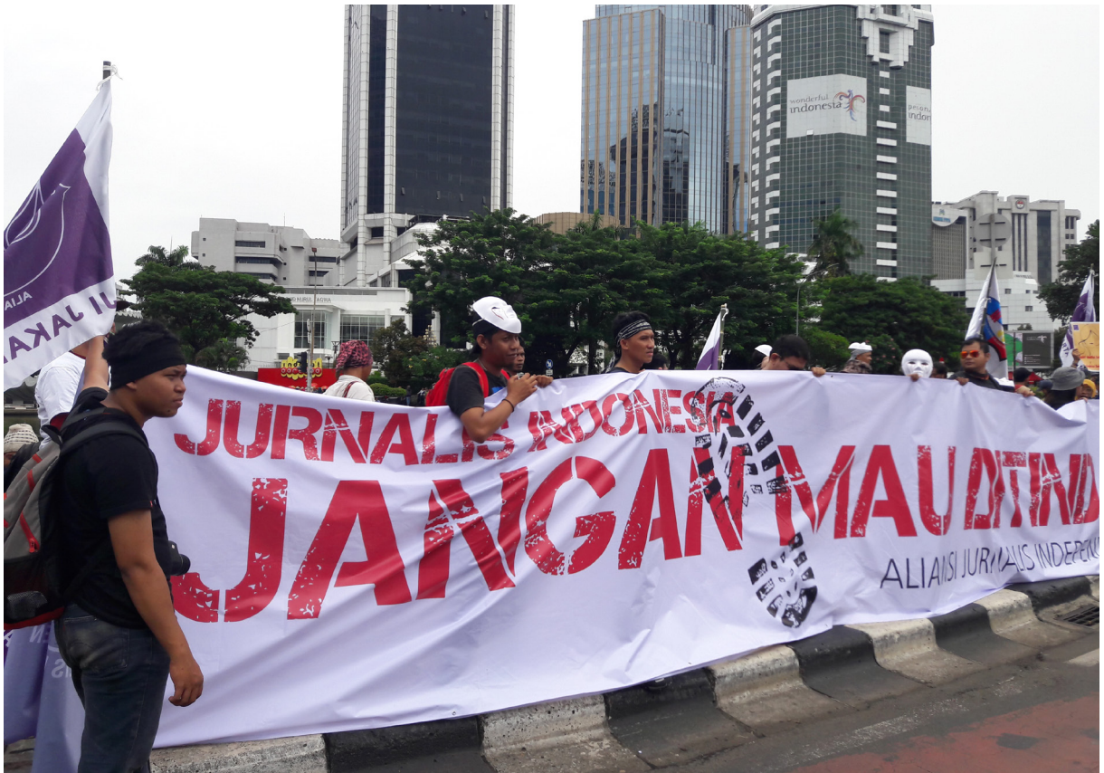
Anggota AJI dalam demonstrasi hari buruh di Jakarta, 1 Mei 2019.