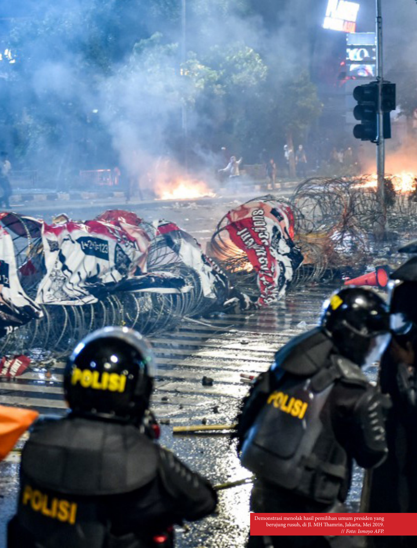
Demonstrasi menolak hasil pemilihan umum presiden yang berujung rusuh, di Jl. MH Thamrin, Jakarta, Mei 2019.