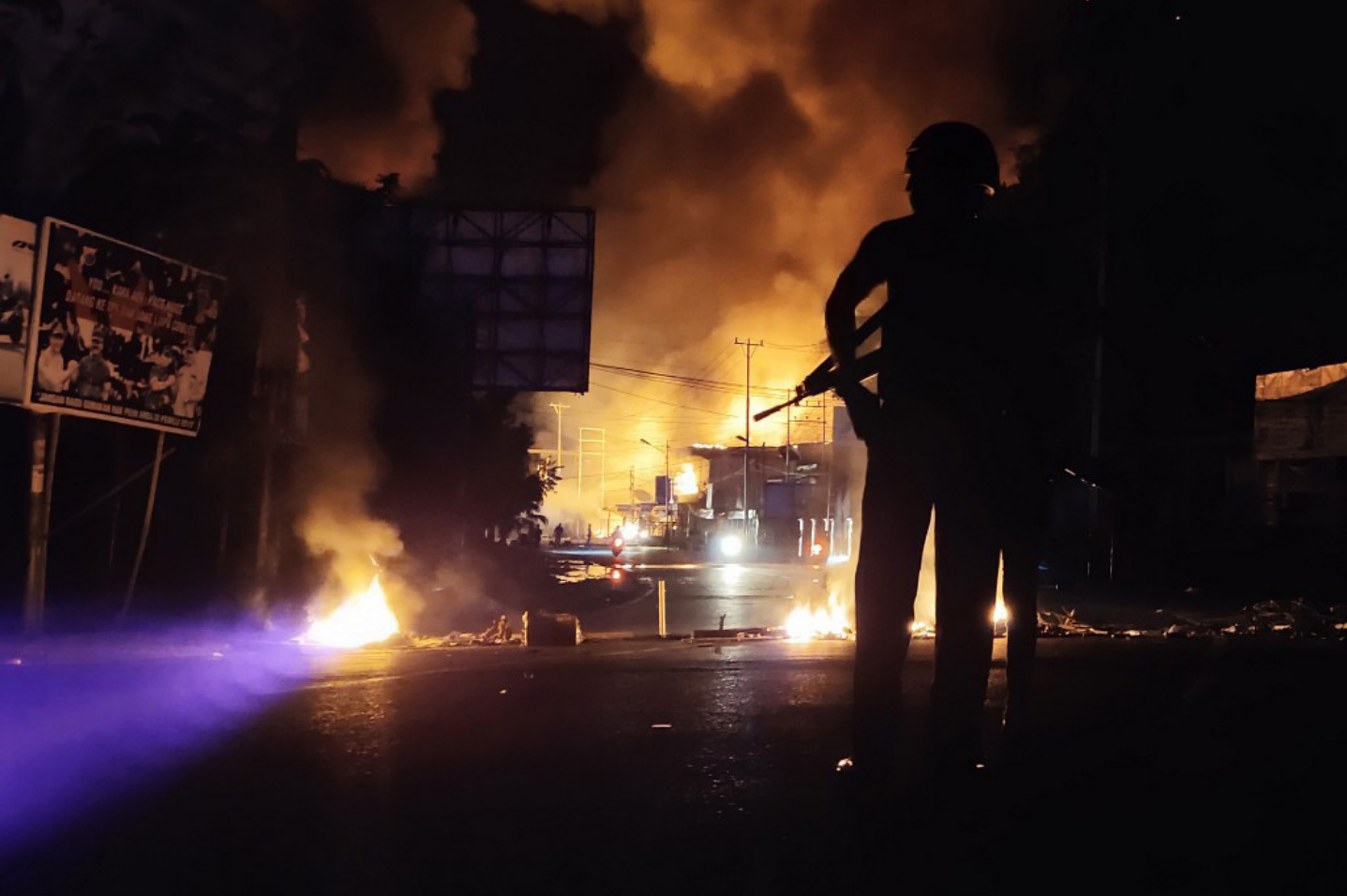
Kebakaran dalam sebuah kerusuhan di Kota Jayapura, Papua, Agustus 2019.

independensi kami dan melihat kami sebagai bagian dari pendukung gerakan kemerdekaan,” tambah Victor.