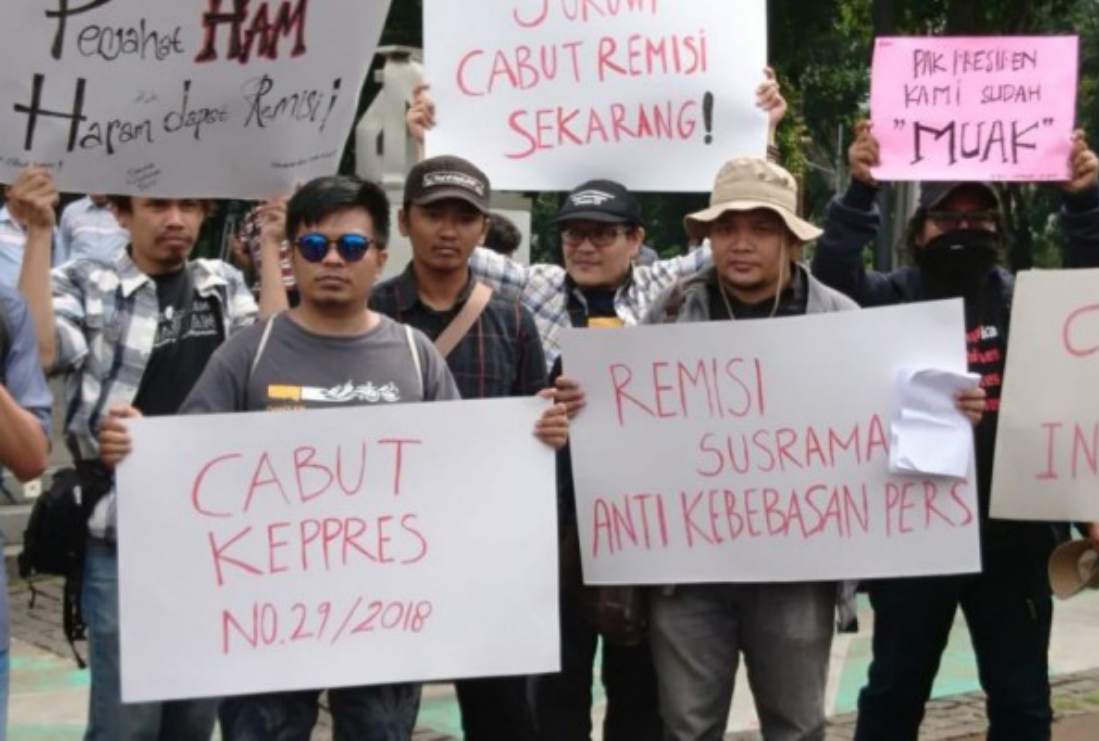
AJI dan organisasi masyarakat sipil menggelar demonstrasi menolak pemberian remisi kepada terpidana I Nyoman Susrama, dalang pembunuh jurnalis AA Gde Bagus Prabangsa. Jakarta, Jumat, (25/1/2019).

oleh orang tidak dikenal pada Selasa, 30 Juli sekitar pukul 02.00 WIB. Ketika itu Asnawi, istri dan ketiga anaknya tengah terlelap. Saat terbangun, api sudah membakar rumah dan asap mengepul. Istri Asnawi segera menggendong anak terkecil berusia 3 bulan dan Asnawi bergegas menyelamatkan dua anaknya, yang masing-masing berusia 5 tahun dan 7 tahun. Mereka keluar rumah dari pintu belakang. Api menghanguskan mobil dan rumahnya.